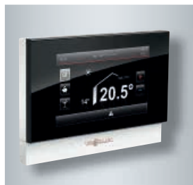
Commande à distance digitale Vitolrol 350

Chaudière compacte entièrement automatique, idéalement prévue pour le neuf et la rénovation.