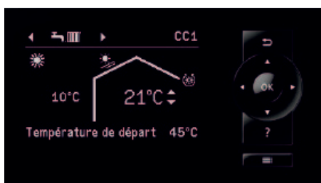
Display de la régulation de pompe à chaleur Vitotronic 200