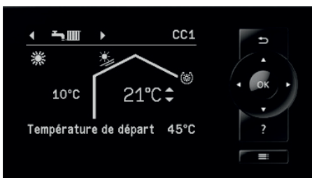
Display de la régulation de pompe à chaleur Vitotronic 200